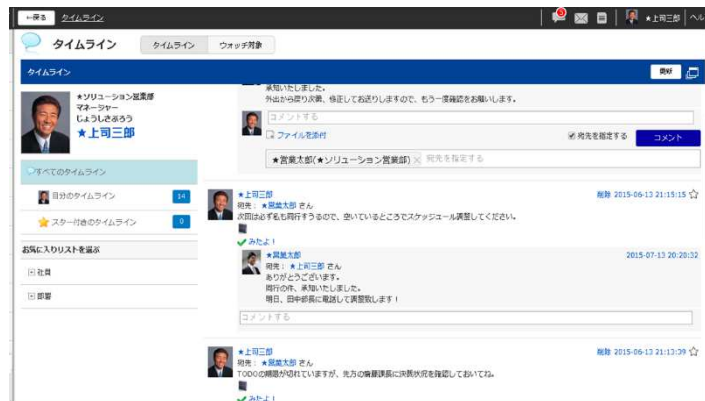
情報を「見せる化」するタイムライン(イメージ)