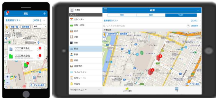
「飛び込み営業」「ついで訪問」で武器になるマップ機能(イメージ)

また、マップ機能を活用し、既存顧客以外の店舗情報をその場で登録、すぐにアプローチをかけ、商談内容を報告し新規顧客を開拓するという営業活動が可能となりました。